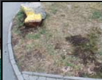
Je to jako v pohádce – byla nebyla. Než jsem značku v trávě zasazenou vyfotila, do rána ji někdo ukrad. Snad nám v dlažbě tentokrát vydrží déle. Zatím stále je.