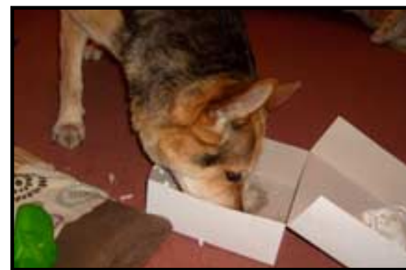
Dodatečně všechno nejlepší ke kulatinám! Dort sice bez svíček, za to ze samých psích dobrot. A talíř? Kdo by se zdržoval.