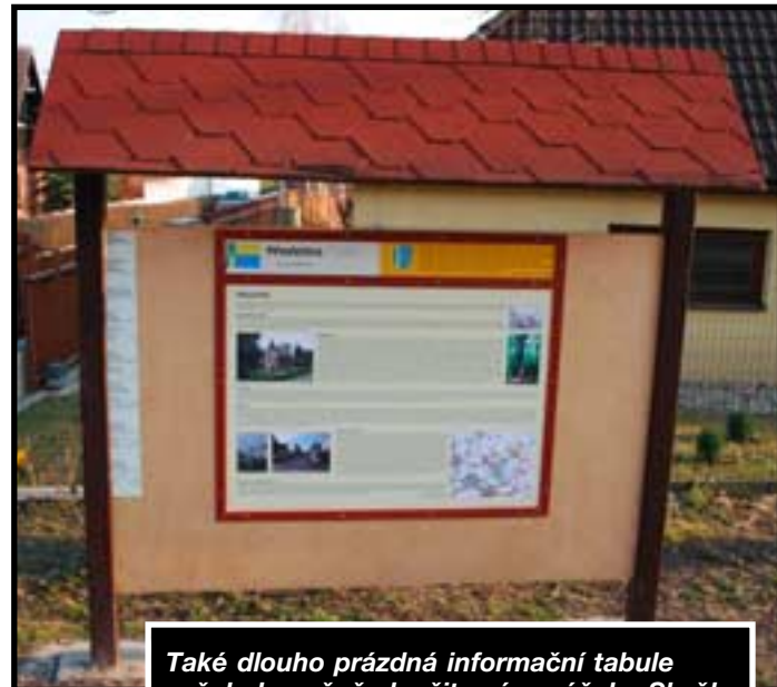
Také dlouho prázdná informační tabule začala konečně sloužit svému účelu. Skvěle zpracované informace o historii Přezletic jistě zlákají k zastávce nejen cyklisty.