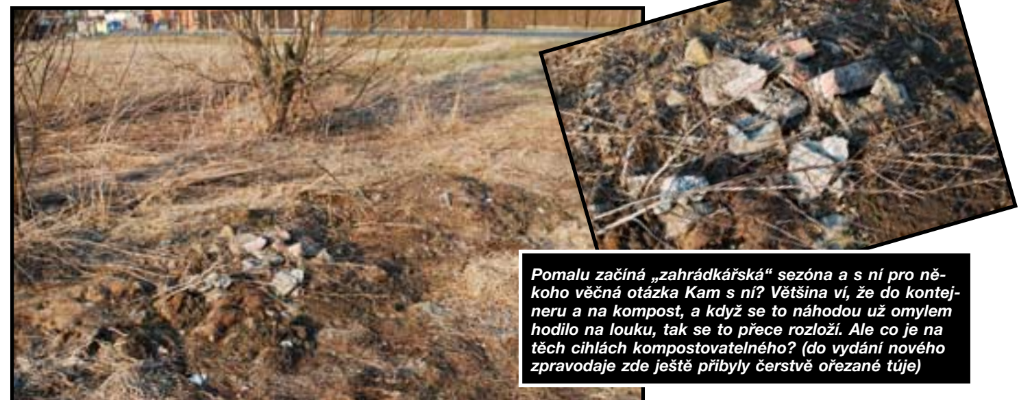
Pomalou začíná „zahrádkářská“ sezóna a s ní pro někoho věčná otázka Kam s ní? Většina ví, že do kontejneru a na kompost, a když se to náhodou už omylem hodilo na louku, tak se to přece rozloží. Ale co je na těch cihlách kompostovatelného? (do vydání nového zpravodaje zde ještě přibyl čerstvě ořezané tují)