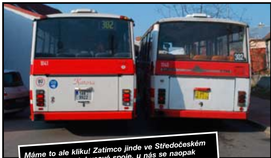
Máme to ale kliku! Zatímco jinde ve Středočeském kraji se ruší autobusové spoje, u nás se naopak posilují. Odted' bude jezdit 302 jen paralelně.