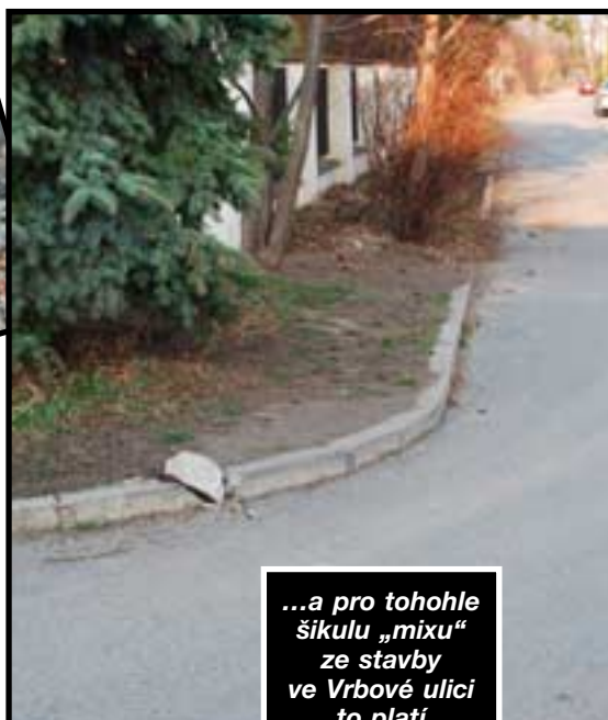
...a pro tohoto šikulu „mixu“ ze stavby ve Vrbové ulici to platí dvojnásob.