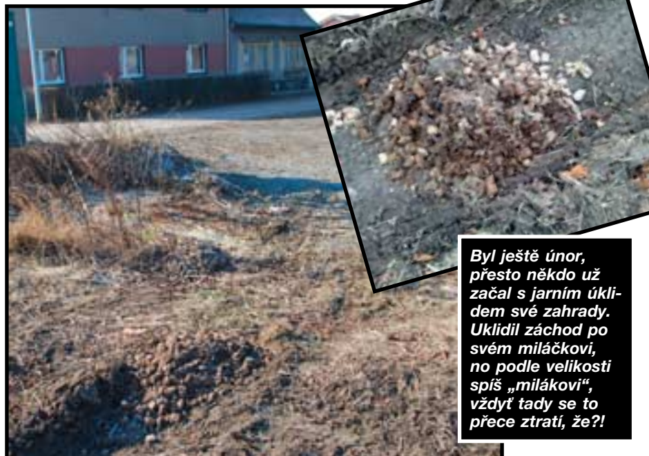
Byl ještě únor, přesto někdo už začal s jarním úklidem své zahrady. Uklidil záchod po svém miláčkoví, no podle velikosti spíš „milákoví“, vždyť tady se to přece ztratí, že?!