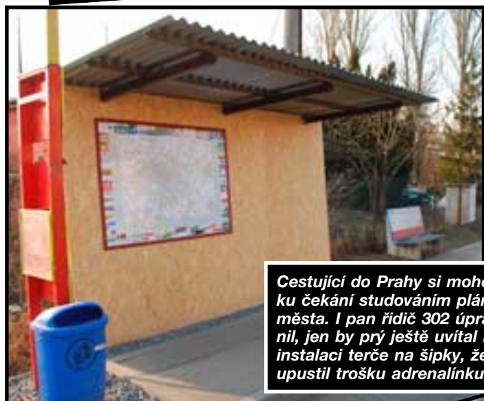
Cestující do Prahy si mohou zkrátit chvíli čekání studováním plánu ulic hlavního města. I pan řidič 302 úpravu zastávky ocenil, jen by prý ještě uvítal na volné ploše instalaci terče na šipky, že by tak upustil trošku adrenalinu.