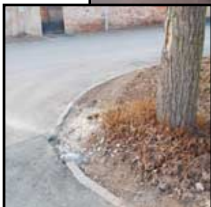
Hurá, máme zase další asfaltovou silnici! I s obrubníky! Zátáčka je jimi pěkně vykroužená, což je pro