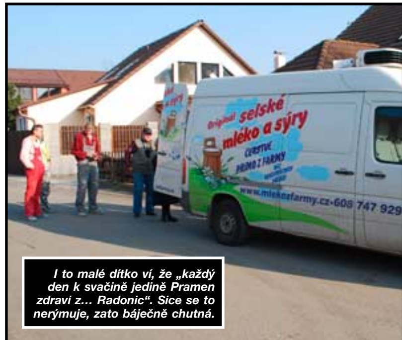
I to malé dítě ví, že „každý den k svačině jedině Pramen zdraví z... Radonic“. Sice se to nerýmuje, zato báječně chutná.