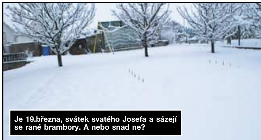
Je 19.března, svátek svatého Josefa a sázejí se rané brambory. A nebo snad ne?