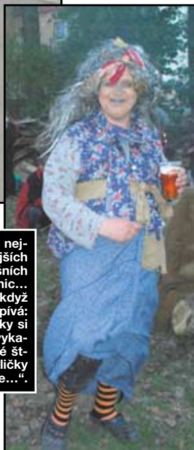
Jedna z nejkrásnějších letošních čarodějnic... A ještě když si zazpívá: „sukýnky si hore vykasuje, své štrampličky ukazuje...“.

...vybaví se jako první každému něco jiného. Rybářům splávek na vodě, někomu hned naskočí rčení „ten má ale splávek“ (na adresu někoho, kdo vypije třeba pivo na ex), přezletickým nohejbalistům tým Splávek, pravidelný to účastník srpnového SWEEDEN CUPu, a nebo si někdo představí malý splav na řece, který je spíš takový splávek.