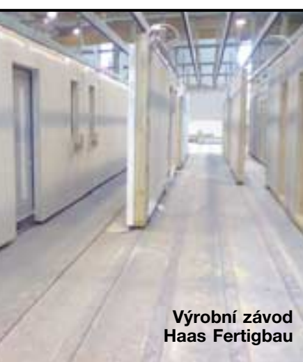
Výrobní závod Haas Fertigbau

„Zakažte vyhláškou podomní prodej!“, volají pak lidé a neuvědomí si, že dodržování vyhlášky může kontrolovat jen oprávněná osoba, a tou je zpravidla městská či obecní policie.