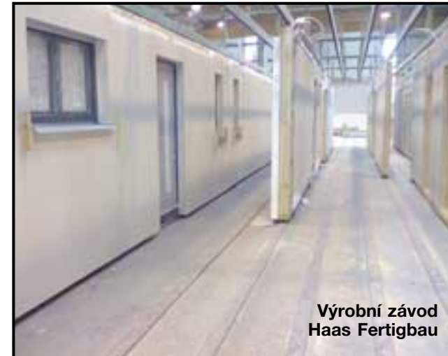
Výrobní závod Haas Fertigbau

Nejdůležitější vyvěšená informace na Úřední desce bylo pro mnoho rodičů dětí předškolního věku oznámení o vítězi výběrového řízení na zhotovitele montované dřevostavby – Mateřské školy Přezletice. Vítězná firma Haas Fertigbau má dlouholetou zkušenost s výstavbou nejen rodinných domů či komerčních budov, ale i v oblasti výstavby mateřských škol. Podle informace starosty obce Rudná, kde na podzim úspěšně firma vystavěla nový pavilon MŠ, také ve velmi rychlém čase a spolupráce zadavatel –