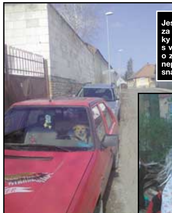
Jestlipak si tento řidič za jízdy šteká: dva roky jezdím bez nehod, s větrem se honím o závod...? Ještěže mě neprotroubil a nebo snad neproštekál?