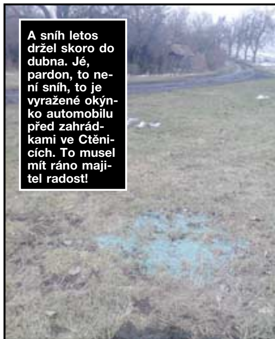
A sníh letos držel skoro do dubna. Jé, pardon, to není sníh, to je vyražené okýnko automobilu před zahrádkami ve Ctěnicích. To musel mít ráno majitel radost!