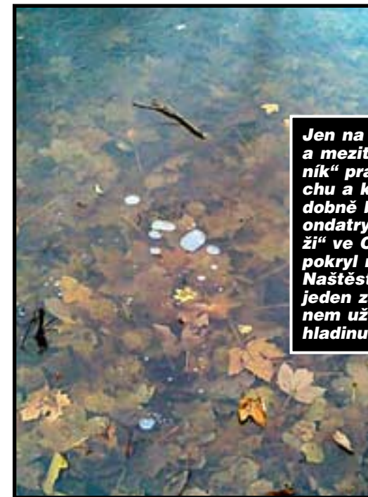
Jen na chvilku jsem si odskočil a mezitím mi mráz zamknul rybník“ pravil v pohádkách z mechu a kapradí malý vodník. Podobně by se mohly cítit naše ondatry či správně nutrie v „louži“ ve Ctěnickém háji, kterou pokrýl mráz slabou vrstvou ledu. Naštěstí bylo zamčeno sotva na jeden západ a tak před polednem už obě vodní myši brázdily hladinu jako malé ledoborce.