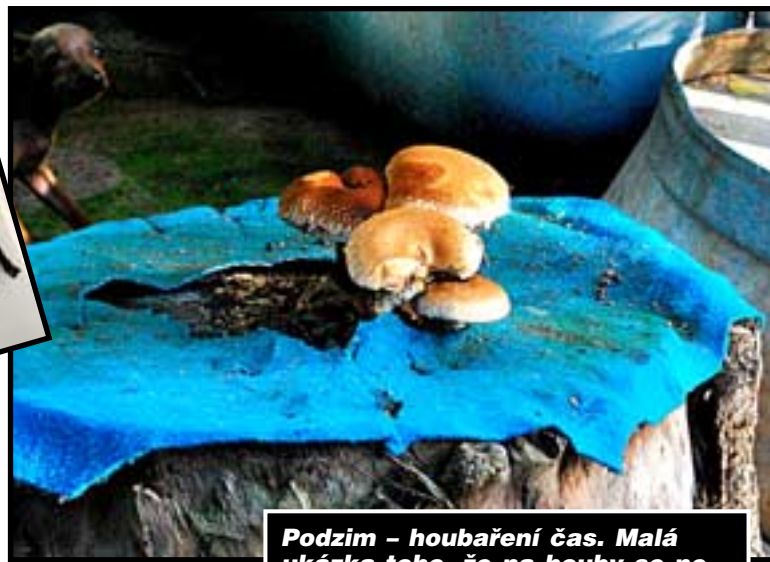
Podzim – houbaření čas. Malá ukázka toho, že na houby se nemusí jen do lesa, stačí dojít na dvorek a houbobraní může začít.