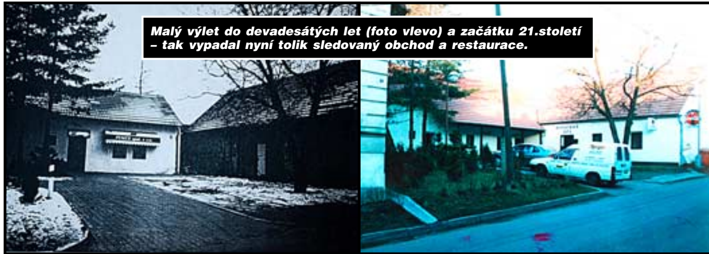
Malý výlet do devadesátých let (foto vlevo) a začátku 21.století – tak vypadal nyní tolik sledovaný obchod a restaurace.