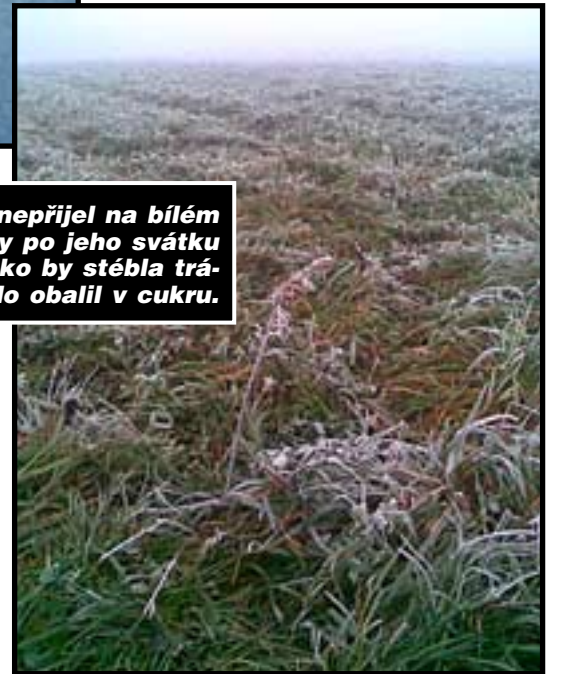
Svatý Martin sice nepřijel na bílém koni, přesto dva dny po jeho svátku byly Přezletice bílé jako by stébla trávy a listy stromů někdo obalil v cukru.