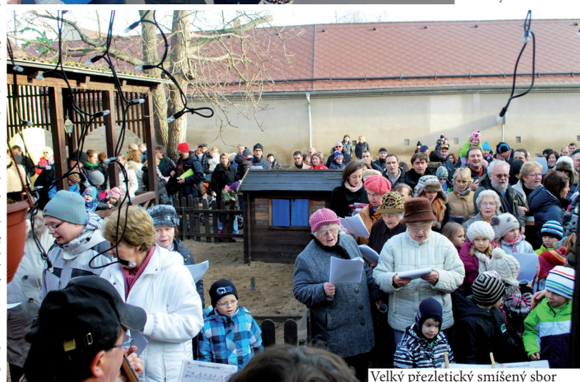
Velký přezletický smíšený sbor

munikací a dešťové kanalizace v Kaštanové – Horní náves a V Podskalí). Zároveň jsme jako člen Místní akční skupiny (MAS) Nad Prahou požádali o dotaci na rekonstrukci autobusových zastávek v obci a tuto dotaci získali! Bohužel zastávka Vinořská je na pozemcích ve vlastnictví Středočeského kraje a nikoliv obce, takže jsme mohli požádat o dotaci pouze na zastávku Horní náves, která je zcela na obecním pozemku.