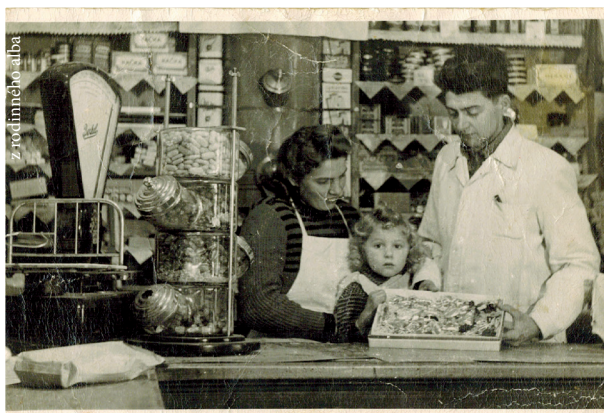
z rodinného alba

„Ano, přijeli v roce 1951. Ale ještě před tím, když byl Olince rok, tak jsme jeli do Polska my. Jeli jsme vlakem a na nádraží do Volštiny pro nás