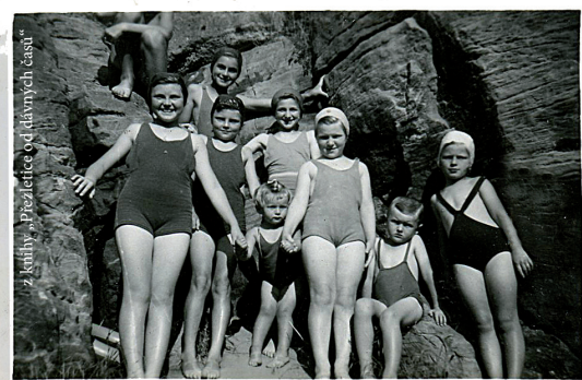
Koupání ve vinořských Obůrkách