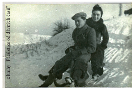
Sáňkování na stráni v Nohavičce.