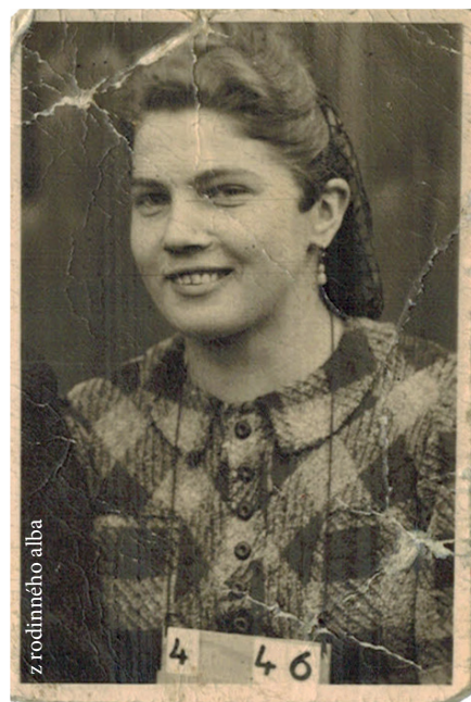
z rodinného alba