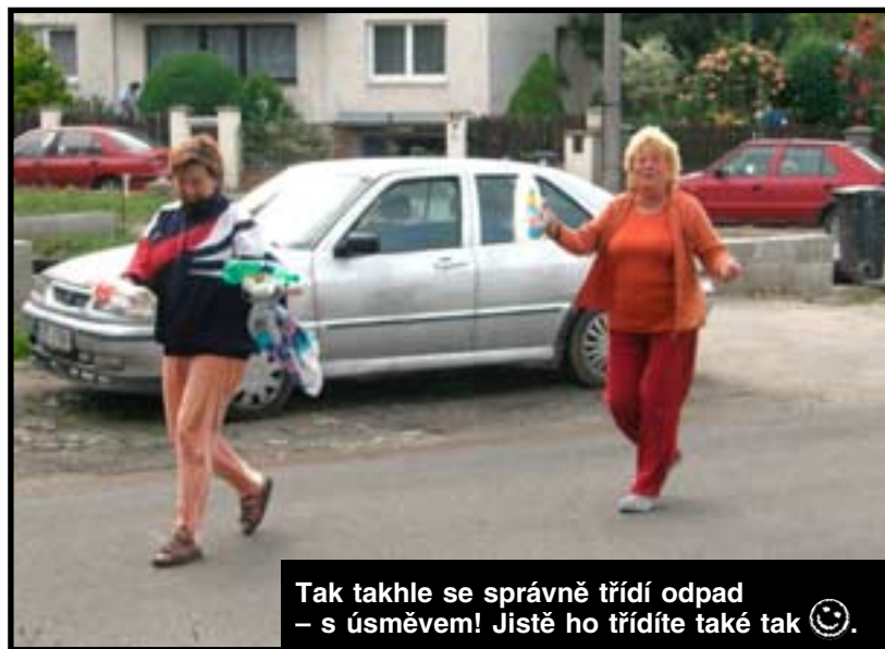
Tak takhle se správně třídí odpad – s úsměvem! Jistě ho třídíte také tak 😊.