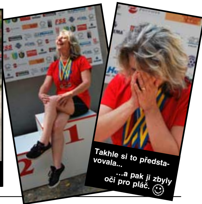
Takhle si to představovala... ...a pak jí zbyly oči pro pláč. 😊