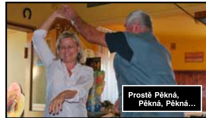
Prostě Pěkná, Pěkná, Pěkná...