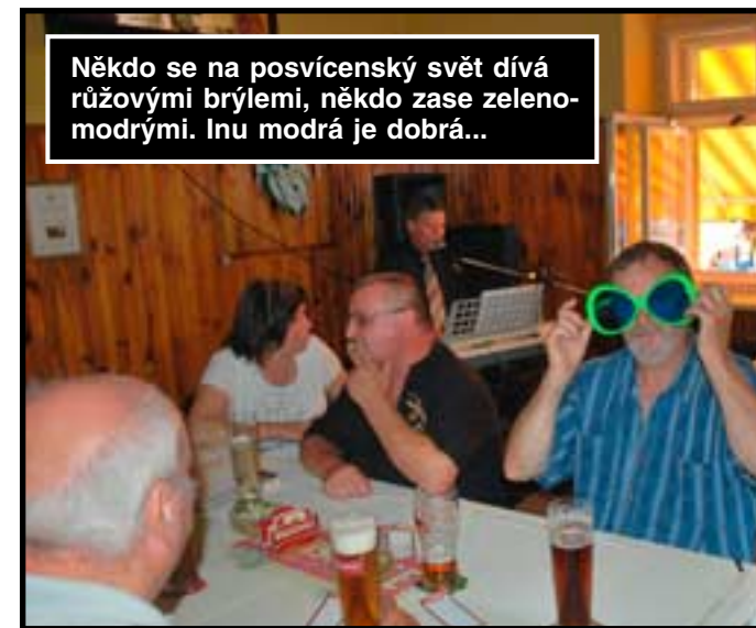
Někdo se na posvícenský svět dívá růžovými brýlemi, někdo zase zeleno- modrými. Inu modrá je dobrá...