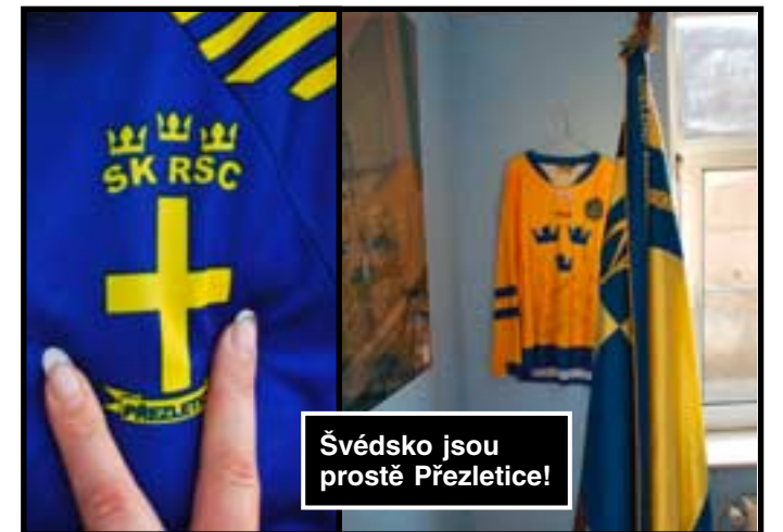
Švédsko jsou prostě Přezletice!