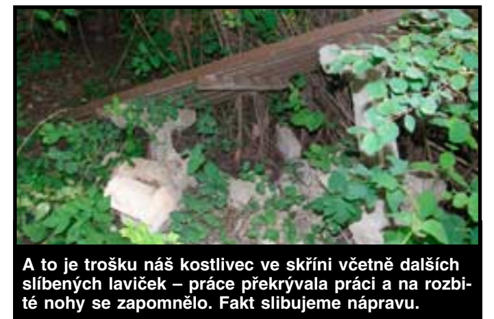
A to je trošku náš kostlivec ve skříni včetně dalších slíbených laviček – práce překrývala práci a na rozbi- té nohy se zapomnělo. Fakt slibujeme nápravu.