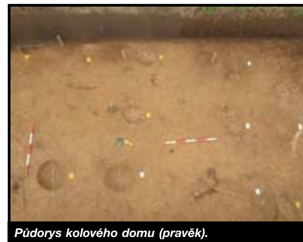
Půdorys kolového domu (pravěk).

Kromě zásobních jam pak bylo identifikováno velké množství kúlových jamek a větších sloupových jam. Tyto jámy jsou pozůstatky po kúlech, které mohly tvořit konstrukci obydlí, nebo jiné stavby. Na výzkumu v Přezleticích byla identifikována jedna taková struktura, která zřejmě představuje pozůstatek domu z počátku doby železné (Obr. 3). Byl pravděpodobně postaven mezi roky 800-600 př. n. l..