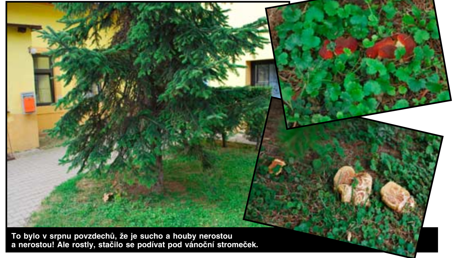
To bylo v srpnu povzdechů, že je sucho a houby nerostou a nerostou! Ale rostly, stačilo se podívat pod vánoční stromeček.