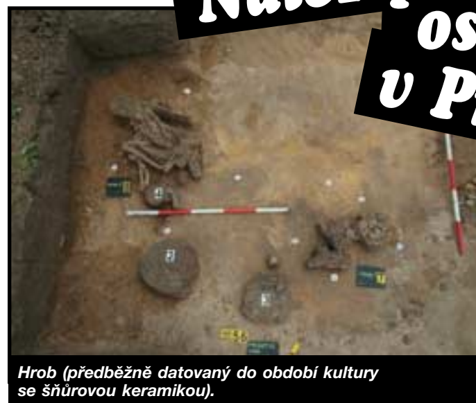
Hrob (předběžně datovaný do období kultury se šňůrovou keramikou).

objekty byly hojně zastoupeny zásobními jámami, které sloužily ke skladování potravin. A v případě, že byly vyprázdněny, byly mnohdy používány jako jámy na odpad. Ty, které byly odkryty v Přezleticích, je možné předběžně datovat do závěru doby bronzové až počátku doby železné, tedy zhruba mezi roky 1000-600 př. n. l. U jedné z nich jsou i kúlové jamky (Obr. 2), které naznačují, že se nad ní mohla nacházet jakási stříška. Rekonstrukci takové stříšky nad zásobní jámou nabízí např. archeoskanzen v Břežně u Loun, i když tam se jedná o rekonstrukci objektu z pozdějšího období.