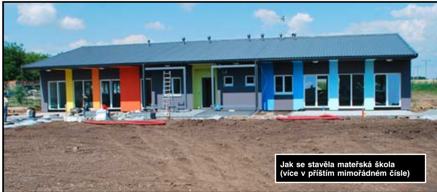
Jak se stavěla mateřská škola (více v příštím mimořádném čísle)