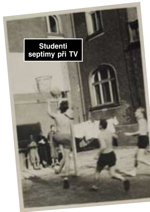
Studenti septimy při TV

první republiky, doba našeho národního uvědomění a hrdosti. Během studia zjišťují, jak se jejich obor v podstatě prolíná i s jejich koníčkem – „Medicína katastrof“ zmiňuje zásahy při leteckých neštěstích, a to včetně transportu pacientů, a Tono vzpomíná na poručíka u průzkumníků, letce, který během 1.světové války na srbské frontě v roce 1915 těžce onemocněl a bylo potřeba jej rychle dopravit do nemocnice. Jenže fronta je hodně vzdálená od zázemí a tak kapitán letectva Paulhan