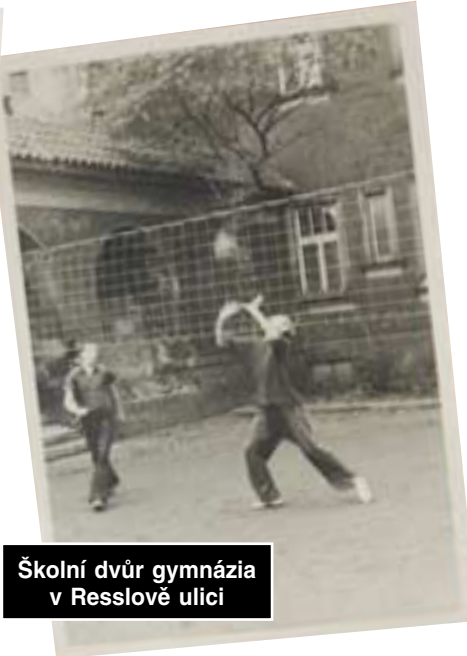
Školní dvůr gymnázia v Resselově ulici

zkouší věc doposud nevídanou – vojenské letadlo využít k přepravě nemocného. Tím pacientem byl Rastislav Štefánik, budoucí ministr vojenství Československé republiky.