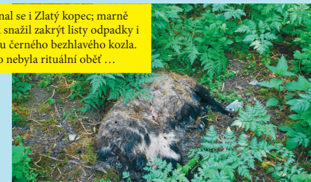
Zazelenal se i Zlatý kopec; marně se však snažil zakrýt listy odpadky i mrtvolu černého bezhlavého kozla. Snad to nebyla rituální oběť ...