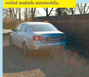
... jen to auto nějak falírovalo v cestě. Naštěstí jasně oranžový sprej v rukou dalšího vyměřovače zvedl z kabiny jeřábu velmi svízně majitele automobilu.