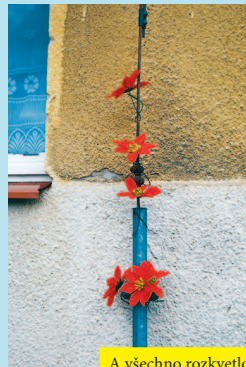
A všechno rozkvetlo - někomu vidle, jinému hromosvod.