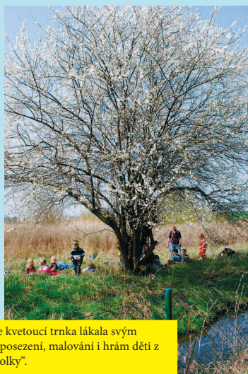
Sněhobíle kvetoucí trnka lákala svým stínem k posezení, malování i hram dětí z „Lesní školky“.