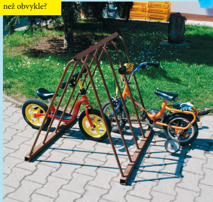
Trochu menší než obvykle?