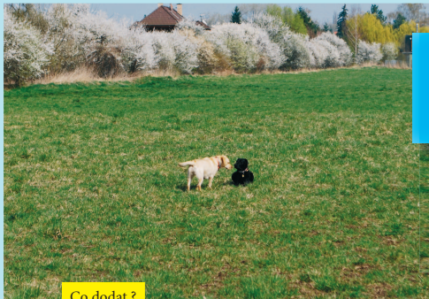
Co dodat ? Jaro je tu !