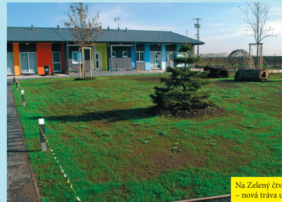
Na Zelený čtvrtek se samozřejmě musí všechno zelenat - nová tráva u školky i pivo vedle v hospodě.