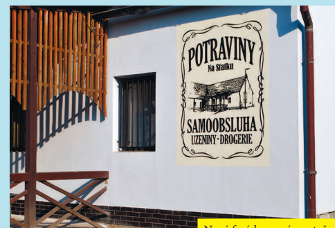
Nová fasáda, nový poutač - jen ty rakve, biče a olejovky pořád chybí 😊.