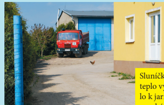
Sluníčko a tepló vybíže- lo k jarním procházkám