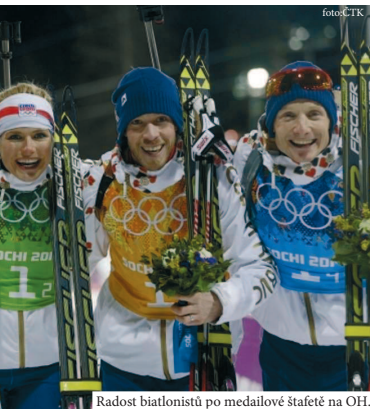
Radost biatlonistů po medailové štafetě na OH.