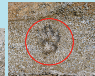
V Hollywoodu mají na chodníku otisknuté dlaně, u nás v Přezleticích na ulici otisknuté tlápičky. Bohužel nejen pacičky, ale i pneumatiky.