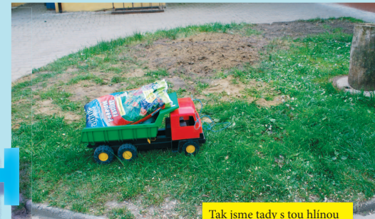
Tak jsme tady s tou hlínou na úpravu zahrady