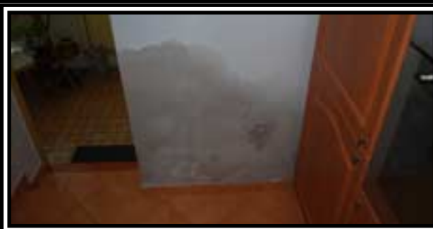
Přišla první obleva a voda nás doslova ničí ze všech stran. Věřte nám, že zastupitelé hledají všemožné cesty, kam vodu z luk, ale hlavně ze sklepů, odvést.