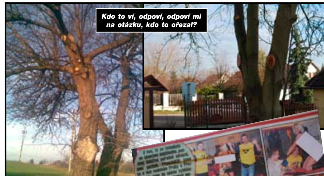
Kdo to ví, odpoví, odpoví mi na otázku, kdo to ořezal?