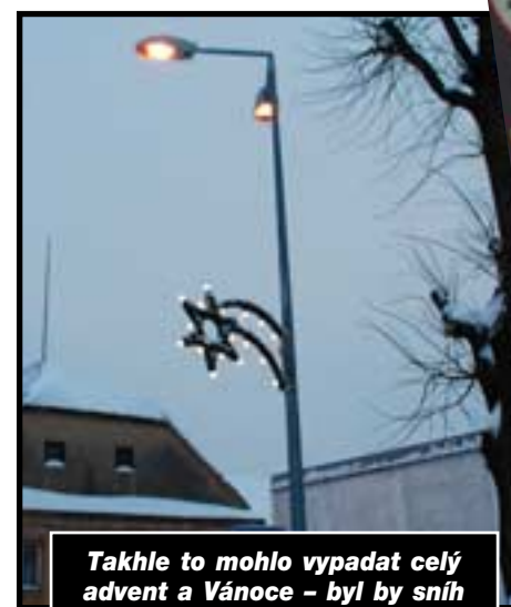
Takhle to mohlo vypadat celý advent a Vánoce - byl by sníh a svítila by nová vánoční výzdoba na Dolní návsi.