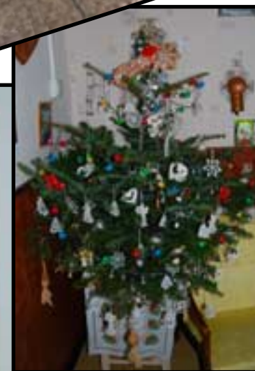
Malá vánoční galerie u paní Schneiderové - vlastnoručně háčkováný Betlém i ozdoby na stromečku.

Zloději, zloději, co po světě chodí... rýmuje se v praštaré říkačce. Jenže oni opravdu chodí a před jejich nenechavými prsty se neschovaly ani figurky z našeho betléma. Svatou rodinku opustil „ten černej vzadu“ a o ruku přišel jeden pastýř. Doufám, že poberta přijde o tu svou! Ony ty středověké zvyky měly něco do sebe.