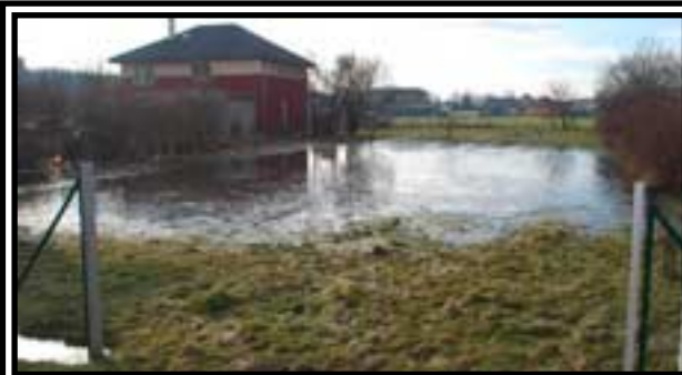
Tohle sice není povánoční zimní idyla, ale malá ukázka pracovních podmínek „našich“ kluků, kteří dobrovolně vzali na svá bedra první, a často i konečnou, pomoc při poruše čerpadla.