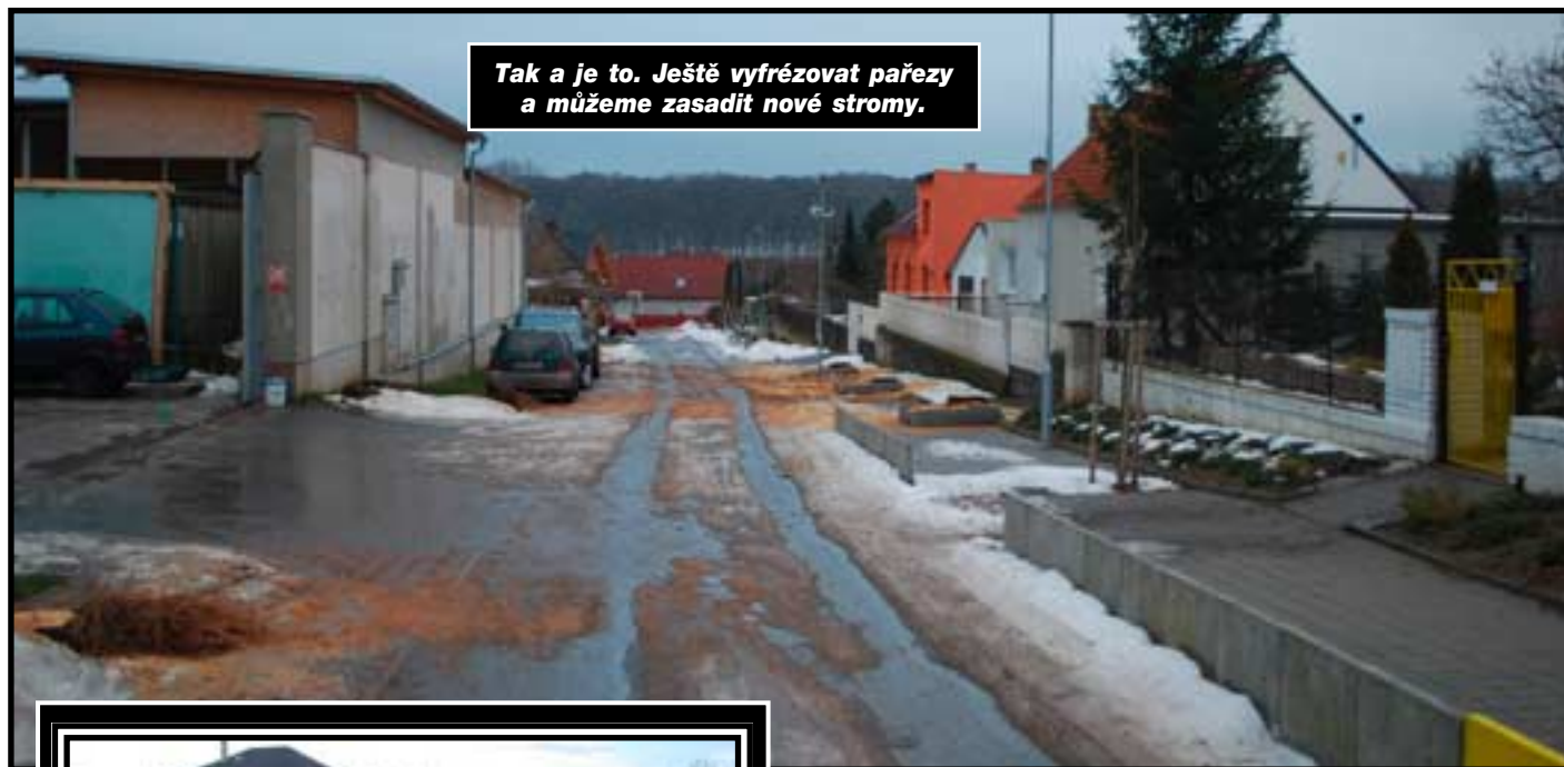
Tak a je to. Ještě vyfrézovat pařezy a můžeme zasadit nové stromy.