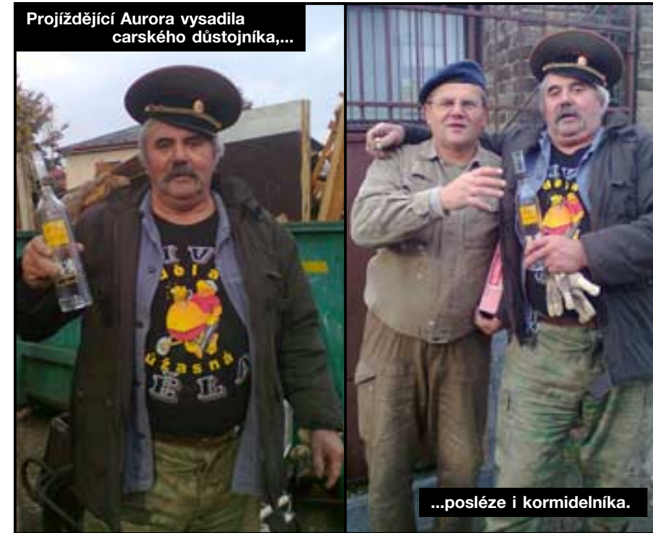
Projíždějící Aurora vysadila carského důstojníka,...