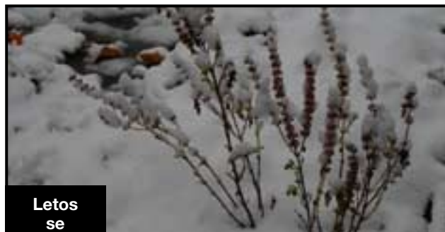
Letos se budou nosit sněhové čepice, řekly si bylinky i kytičky, zvláště bazalce sluší.