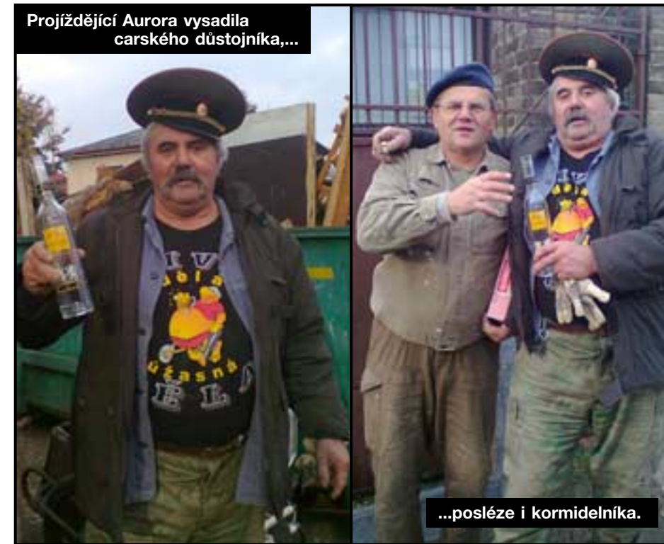
Projíždějící Aurora vysadila carského důstojníka,...