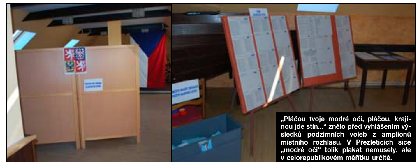
„Pláčou tvoje modré oči, pláčou, krajinou jde stín...“ znělo před vyhlášením výsledků podzimních voleb z ampionů místního rozhlasu. V Přezleticích sice „modré oči“ tolik plakát nemusely, ale v celorepublikovém měřítku určitě.