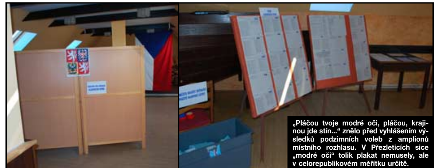
„Pláčou tvoje modré oči, pláčou, krajinou jde stín...“ znělo před vyhlášením výsledků podzimních voleb z ampionů místního rozhlasu. V Přezleticích sice „modré oči“ tolik plakát nemusely, ale v celorepublikovém měřítku určitě.