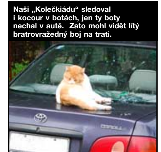
Naši „Kolečkiádu“ sledoval i kocour v botách, jen ty boty nechal v autě. Zato mohl vidět lýtý bratrovražedný boj na trati.