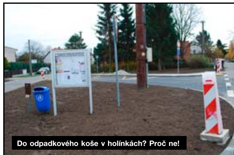
Do odpadkového koše v holínkách? Proč ne!