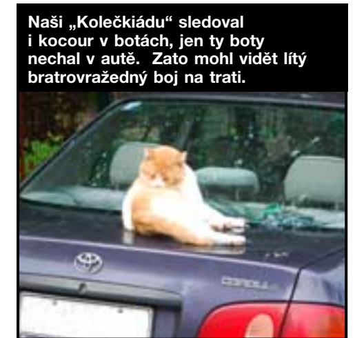
Naši „Kolečkiádu“ sledoval i kocour v botách, jen ty boty nechal v autě. Zato mohl vidět lýtý bratrovražedný boj na trati.