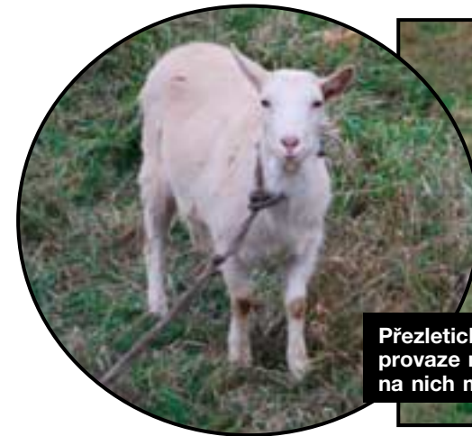
Přezletické kozenky. Ráno jsou vedeny na provaze na pastvu, večer šupajdí domů a děti na nich mohou oči nechat. Měéééééééééé.