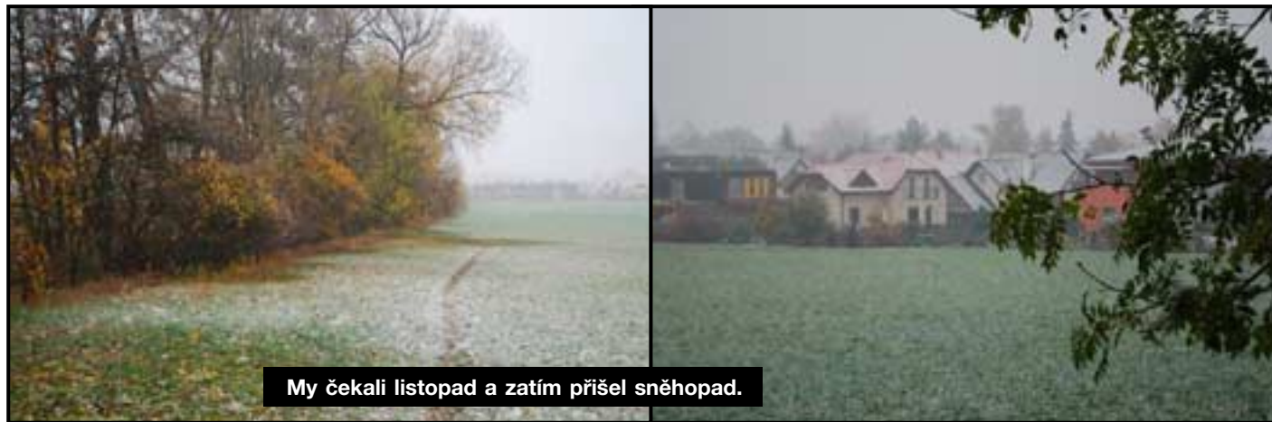
My čekali listopad a zatím přišel sněhpad.