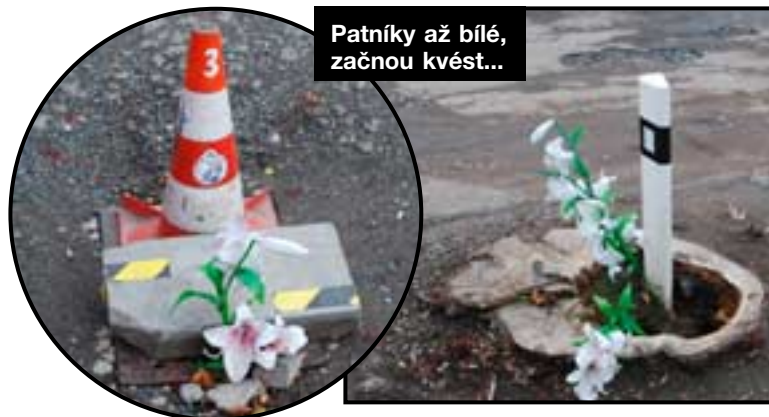
Patníky až bílé, začnou kvést...