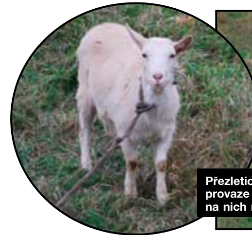
Přezletické kozenky. Ráno jsou vedeny na provaze na pastvu, večer šupajdí domů a děti na nich mohou oči nechat. Měéééééééééé.