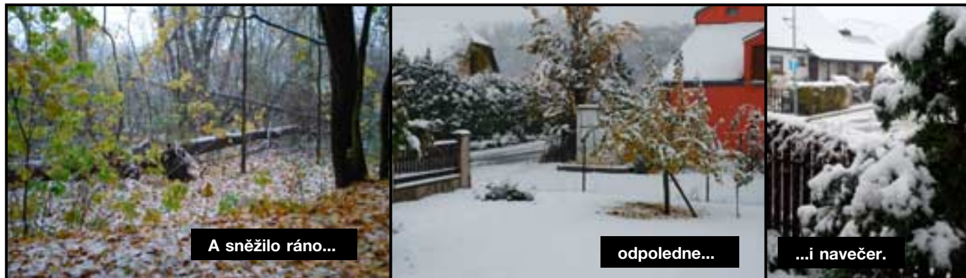
A sněžilo ráno...