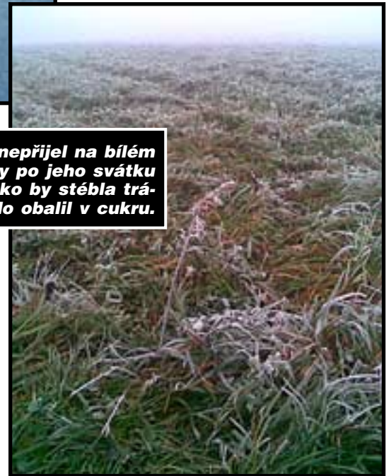
Svatý Martin sice nepřijel na bílém koni, přesto dva dny po jeho svátku byly Přezletice bílé jako by stébla trávy a listy stromů někdo obalil v cukru.