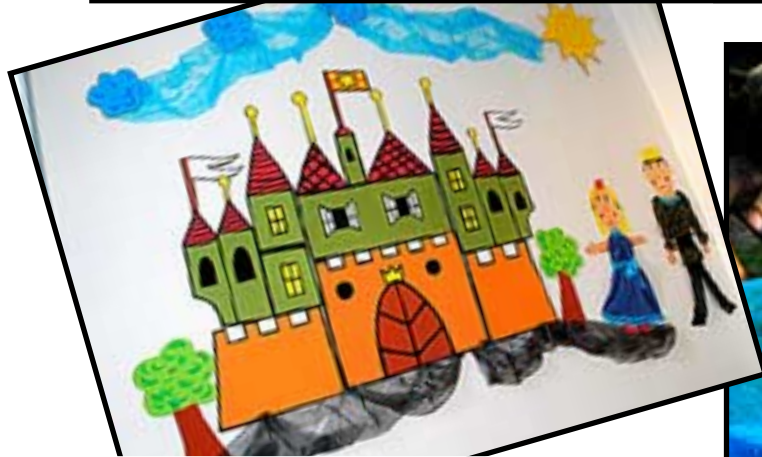
Jó, mít tak hrad... Přezletice svůj mají! A kdepak se nachází? Ani na Hradčanech, ani na OÚ, je ve školce na chodbě a každé ráno vítá všechny děti „do práce“.