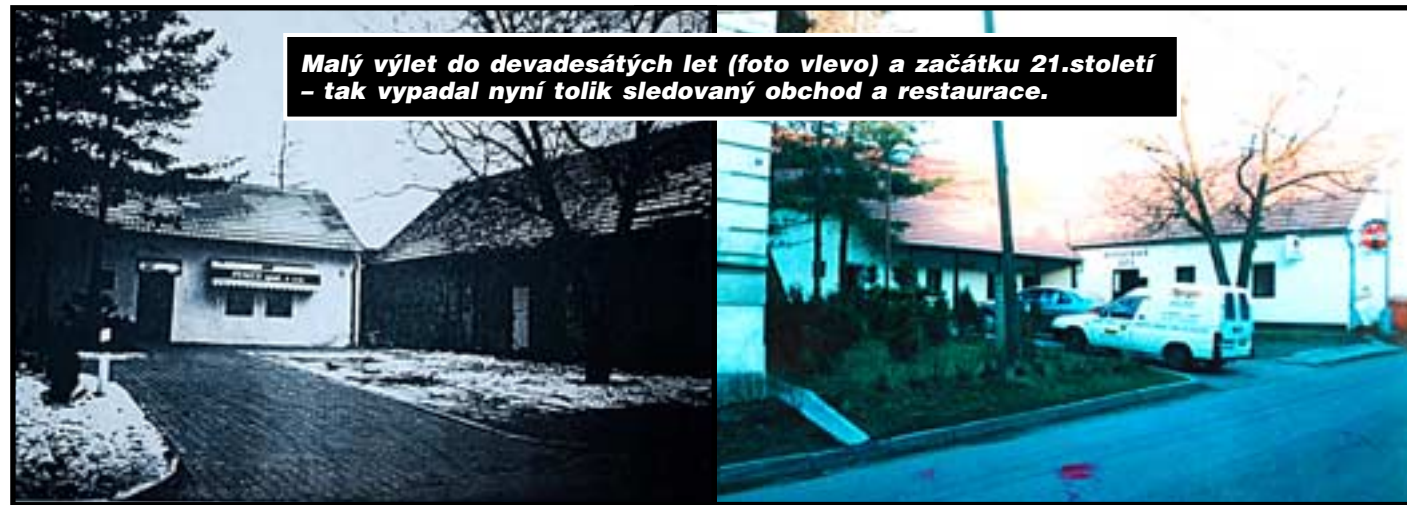
Malý výlet do devadesátých let (foto vlevo) a začátku 21.století – tak vypadal nyní tolik sledovaný obchod a restaurace.