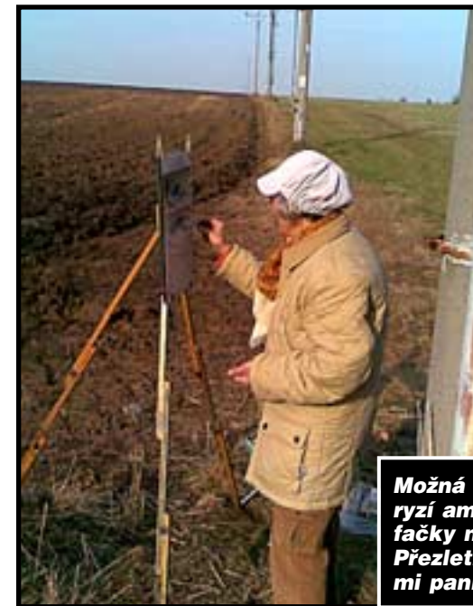
Možná to byla akademická malířka, možná jen ryzí amatérka, přesto bylo podzimní setkání u trafky na Ctěnické velmi milé. „Ráda tu maluju, Přezletice jsou moc krásné a zajímavé“, prozradila mi paní malířka, kterou jsem vyrušila z práce.