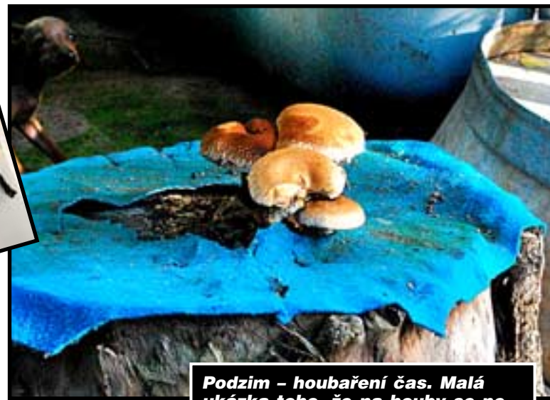
Podzim – houbaření čas. Malá ukázka toho, že na houby se nemusí jen do lesa, stačí dojít na dvorek a houbobraní může začít.