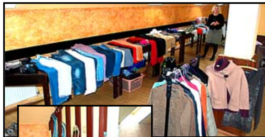
V září se konal malinko netradiční bazar pro ty větší až skoro dospělé děti a bohužel i netradičně skončil – přišla pouhá jedna maminka s náctiletou dcerou. Škoda, protože výběr byl nejen z oblečení.