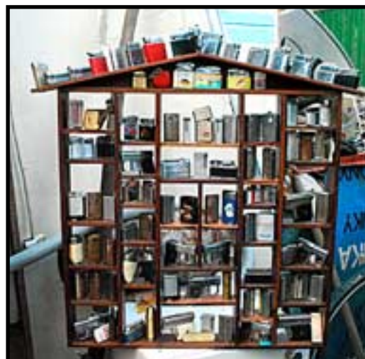
No není to krása? Někdo sbírá známky, někdo vdolky či holky, Ludvík sbírá staré plynové zapalovače