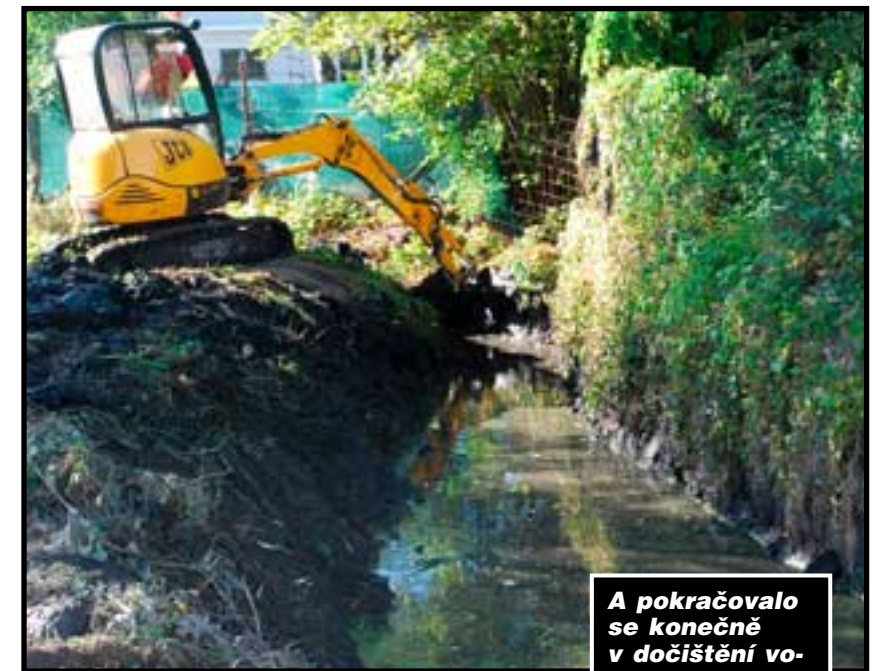
A pokračovalo se konečně v dočištění vodoteče, které skončilo až u samého pramene. To bylo vody, když bagr pramenu uvolnil cestu!