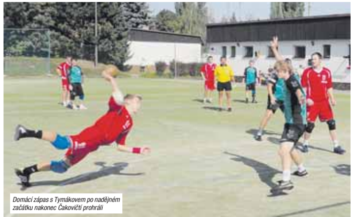
Domácí zápas s Týmákovem po nadějném začátku nakonec Čakovičtí prohráli

vedení. Ovšem deset minut před koncem se Čakovickým podařilo vyrovnat na 6:6, ale domácí proměňovali své šance. Ve druhém poločase si domácí už jen udržovali náskok. „Konečně po dobu výsledku určilo posledních deset minut zápasu, kdy domácí vstřelili už jen jeden gól a nám se podařilo překonat jejich obranu i s brankářem ještě třikrát. A tak utkání skončilo výhrou Krčína 20:14,“ dodává trenér Molnár. V 5. kole přivítali Čakovičtí na svém hřišti soupeře z Nezvěstic a zápas se jim povedl. Po vyrovnané první půli se šlo do kabin za stavu 13:12 pro domácí. Ve druhé půli Čakovičtí ještě více přidali a po kvalitním výkonu nakonec zvítězili 24:18 a radují se z první ligové výhry. Jaroslav Svoboda