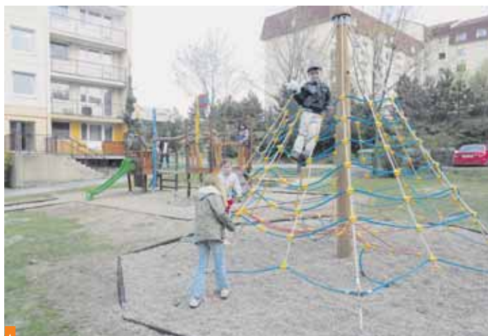
Dětské hřiště Pod Tvrzí