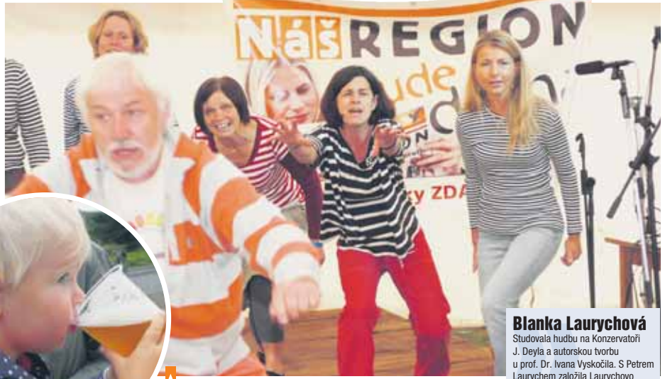
Hudebně pohybový soubor Rybičky jedním z nejzajímavějších účastníků celé akce

Na akci se představila celá řada známých umělců zjiřících a působících v regionu, např. Ivan Hlas a jeho TRIO, Radim Hladík a Blue Effect, skupina Vitáci s Láďou Křížkem či výtvarník a performer Petr Níkl. Akci podpořil mj. ústečský pivovar, ale kromě piva si mohli návštěvníci pochutnat i na dalším občerstvení.