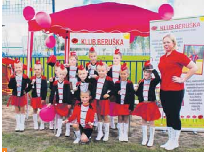
Dětský soubor minimažoretek Berušek z „Vodolky“