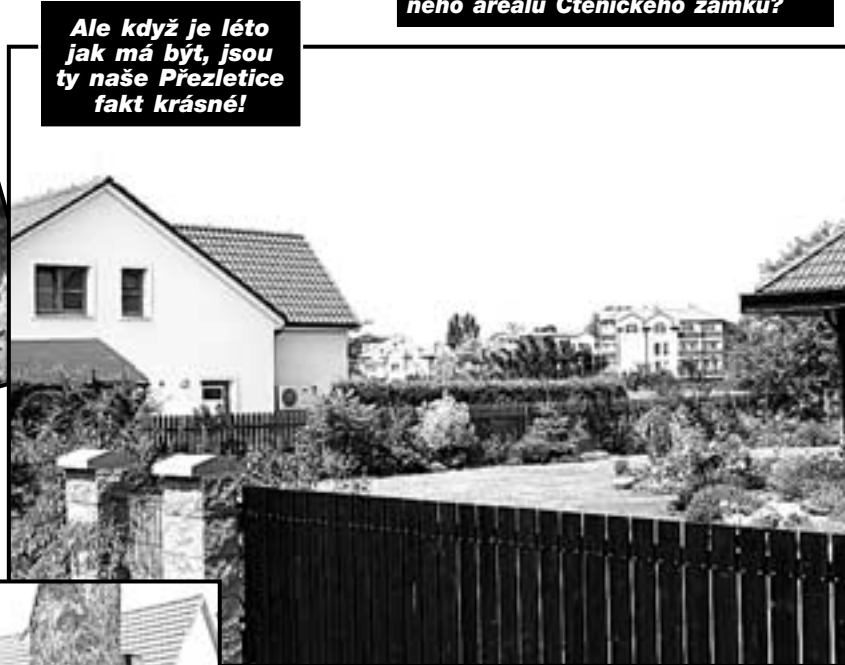
Ale když je léto jak má být, jsou ty naše Přezletice fakt krásné!