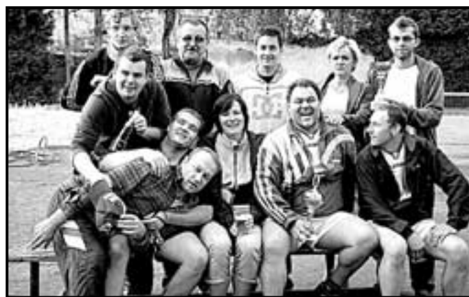
Sliby se mají plnit, i když nejsou Vánoce. Ale opravdu nevím, kdo je na „tu onu“ zvědavý!