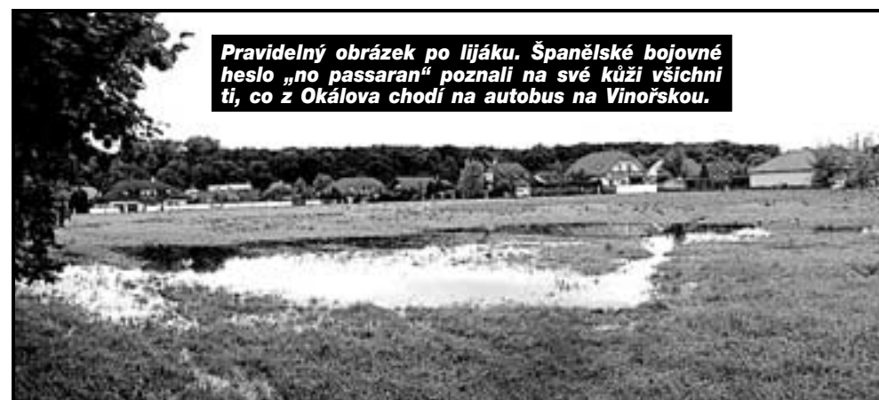
Pravidelný obrázek po lijáku. Španělské bojovné heslo „no passarán“ poznali na své kůži všichni ti, co z Okálova chodí na autobus na Vinořskou.