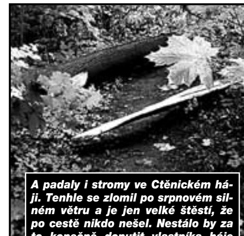
A padaly i stromy ve Ctěnickém háji. Tenhle se zlomil po srpnovém silném větru a je jen velké štěstí, že po cestě nikdo nešel. Nestálo by za to konečně donutit vlastníka háje Lesy ČR, aby se o tuto bývalou oboru staral? A nebo dotáhnout do konce jednání o převodu na městskou část Prahy 9 a vrátit oboře důstojné místo v rámci tolik navštěvovaného areálu Ctěnického zámku?