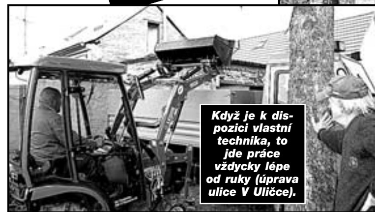
Když je k dispozici vlastní technika, to jde práce vždycky lépe od ruky (úprava ulice V Uličce).