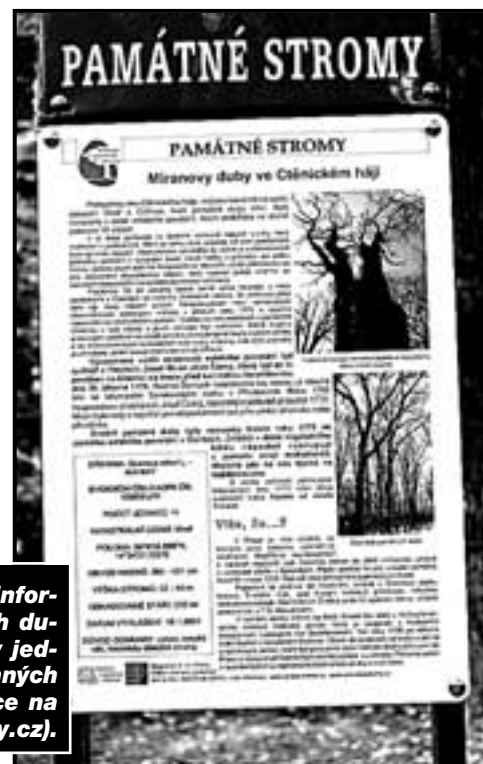
PV létě byla vyměněna informační tabule u Miranových dubů; „naše stromy“ se staly jedním z 18 historicky významných stromů na území Prahy (více na www.prazskestromy.cz ).