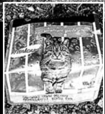
Každotýdenní skládka u kontejnerů na rohu Topolové. Je to prostě pro zlost nebo spíš „pro kočku“?!