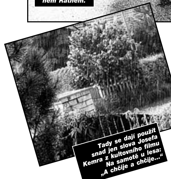
Tady se dají použít snad jen slova Josefa Kemra z kultovního filmu Na samotě u lesa: „A chčije a chčije...“