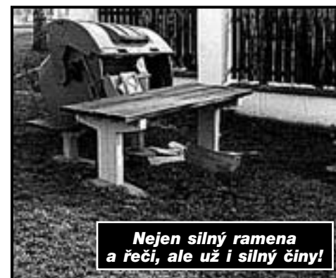
Nejen silný ramena a řeči, ale už i silný činy!