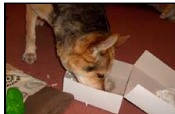
Dodatečně všechno nejlepší ke kulatinám! Dort sice bez svíček, za to ze samých psích dobrot. A talíř? Kdo by se zdržoval.