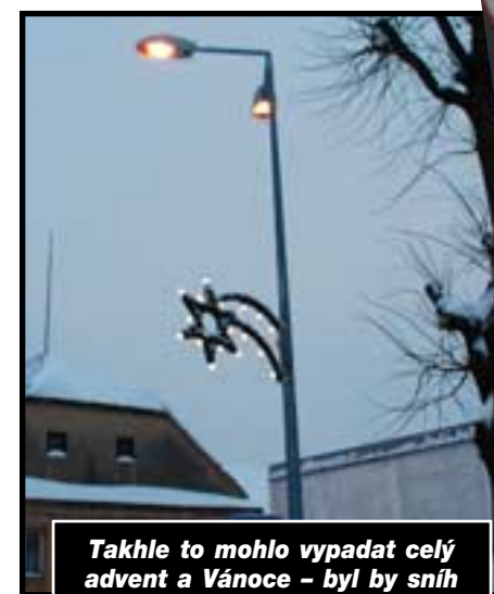
Takhle to mohlo vypadat celý advent a Vánoce - byl by sníh a svítila by nová vánoční výzdoba na Dolní návsi.