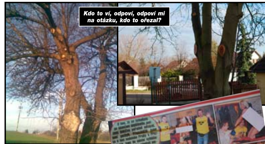
Kdo to ví, odpoví, odpoví mi na otázku, kdo to ořezal?