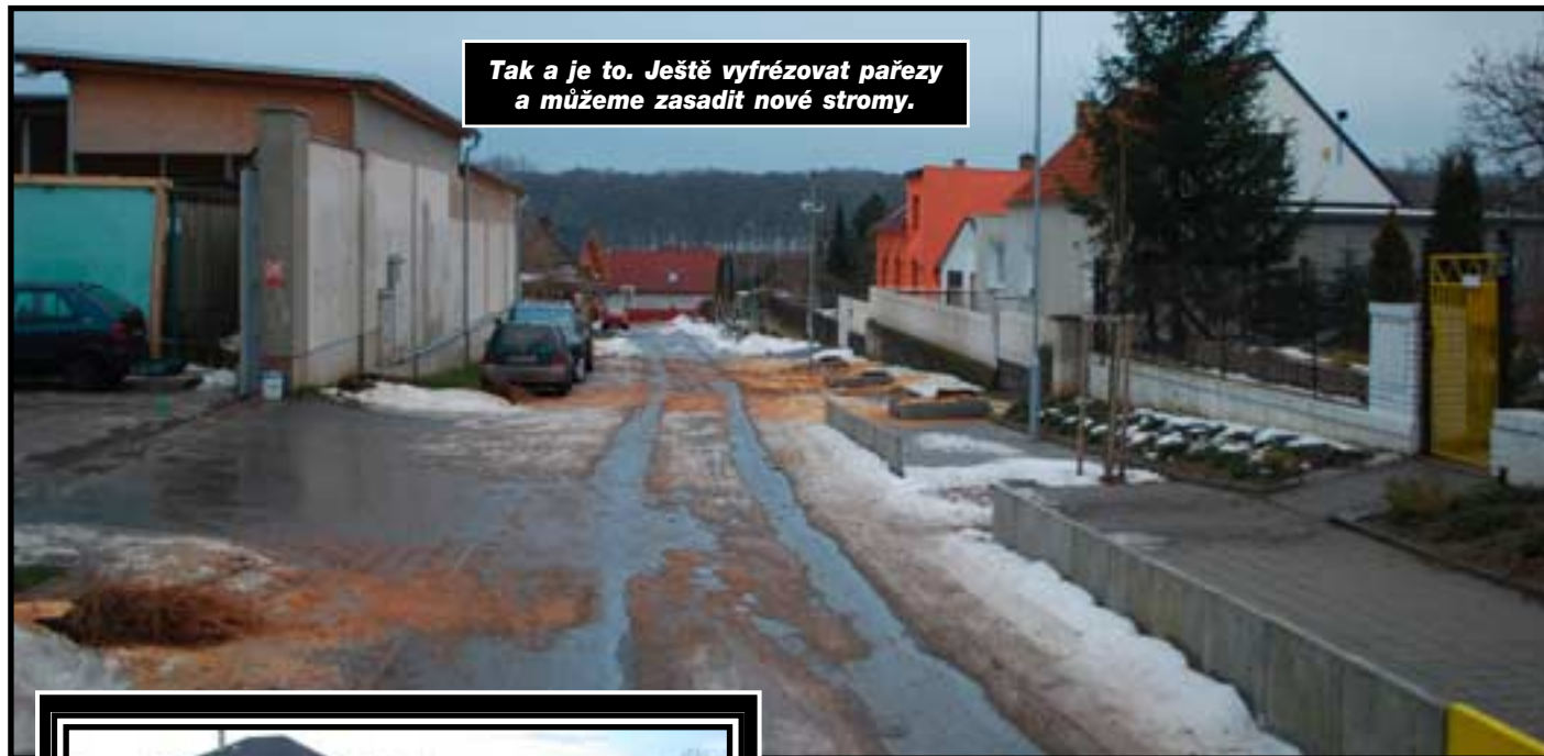
Tak a je to. Ještě vyfrézovat pařezy a můžeme zasadit nové stromy.